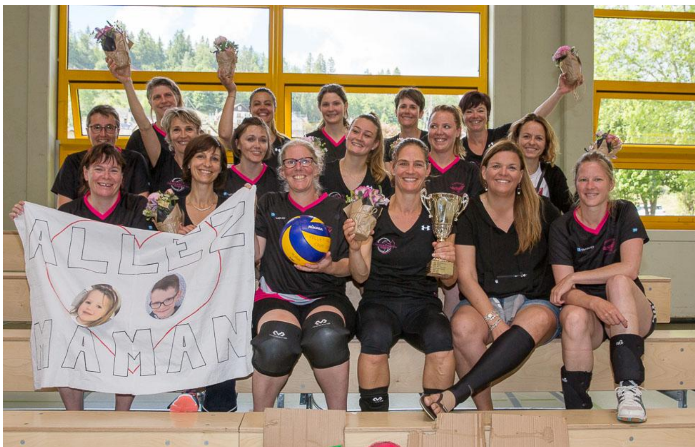
© Stéphane Schneider – Finalistes femmes